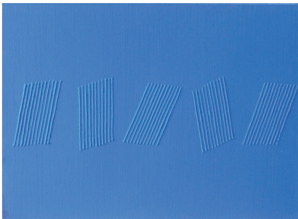
Z25 - 33x46 cm

Aujourd' hui fidèle à sa ligne d'exposition, la galerie Lipao-Huang nous invite à découvrir les oeuvres abstraites de la maturité de l'artiste Dodinh d'origine vietnamienne.