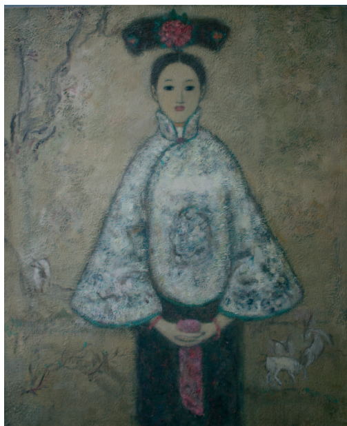
Xiao Wang , 45x37 cm, h/t